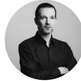
Jaano Inno Äriarenduse konsultant